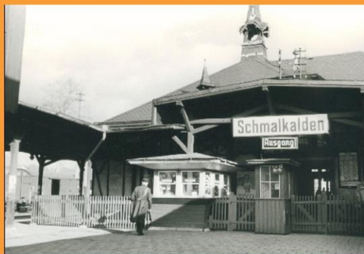
Foto: vor 1913