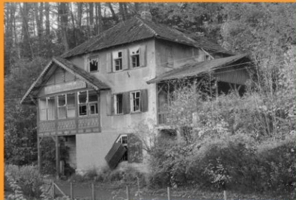
Schmalkalden, 1989