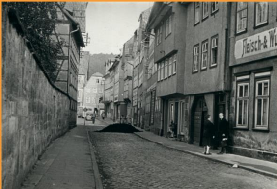
Schmalkalden, 1958