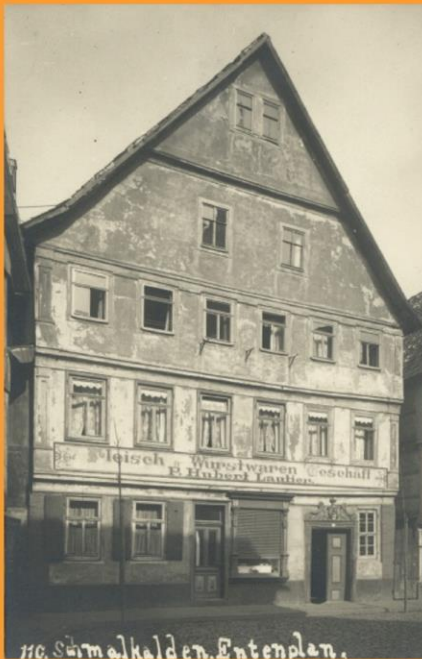
Entenplan 3, vor 1945 Entenplan 11 und Entenplan 13 "Städtisches Armenhaus", 1888